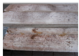
ปี่สาแผ่นดวงการตรวจดวงชะตา (ฉบับครูบาวาวิชัยอดีตเจ้าอาวาสวัดเหมืองหม้ออำเภอเมือง จังหวัด

มงคลแนวคิดความเชื่อในการสืบชะตาที่สัมพันธ์กับตัวบุคคลหรือปัจเจกบุคคลและแนวคิดและความเชื่อในการสืบชะตาที่สัมพันธ์กับวิถีวัฒนธรรมประเพณีของล้านนาโดยตรง