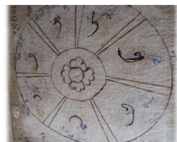
สูตรการตรวจดวงชะตาของเจ้า ชะตาแต่ละคนก่อนทำพิธีสืบชะตา

แนวคิดของคนล้านนาเกิดมา จาก ความ ศรัทธา ใน พระพุทธศาสนาจากการได้ ศึกษาพระธรรมคำสอนของ พระสัมมาสัมพุทธเจ้าทำให้มี ความคิดที่จะทำที่บ้านเมือง