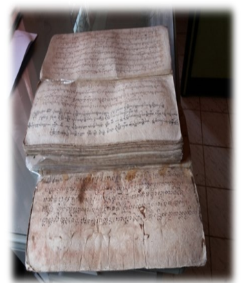
สืบสาพิธีสืบชะตาฉบับครูบาภา วีย์วัดเหมืองหม้อ อ.เมือง จ.แพร่

ศาสนา พราหมณ์เมื่อพระพุทธศาสนาได้แผ่ขยายเข้ามาในดินแดนนี้ก็ได้ยอมรับนับถือเอาคำสอนทางพระพุทธศาสนาเข้ามาเป็นแนวทางดำเนินชีวิตสืบทอดกันมาจากรุ่นสู่รุ่นการปฏิบัติพิธีกรรมทางพระพุทธศาสนามีการผสมผสานกลมกลืนกันได้อย่างสนิทชนิดแยกกันไม่ออกระหว่างพิธีกรรมทางพระพุทธศาสนา และพิธีกรรมทางศาสนาพราหมณ์