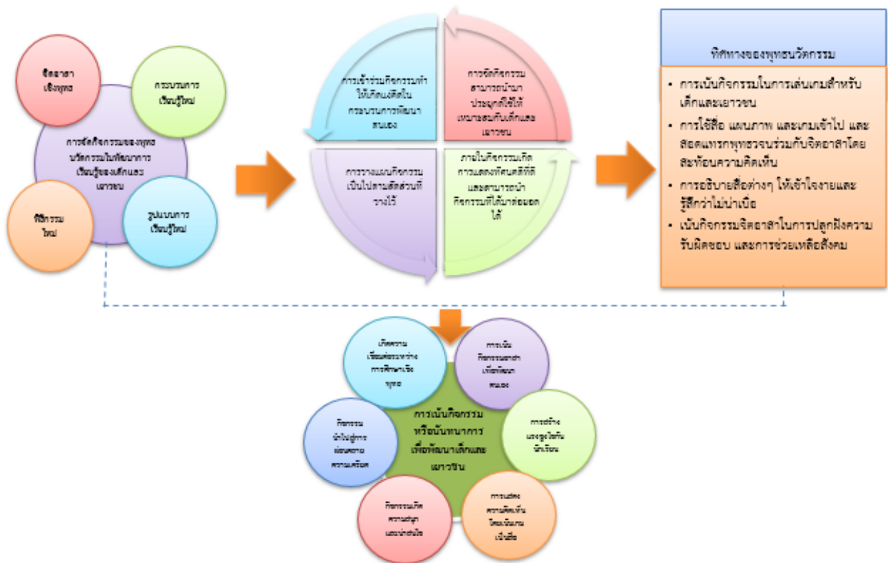
แผนภาพที่ 3 องค์ความรู้ที่ได้จากการวิจัย