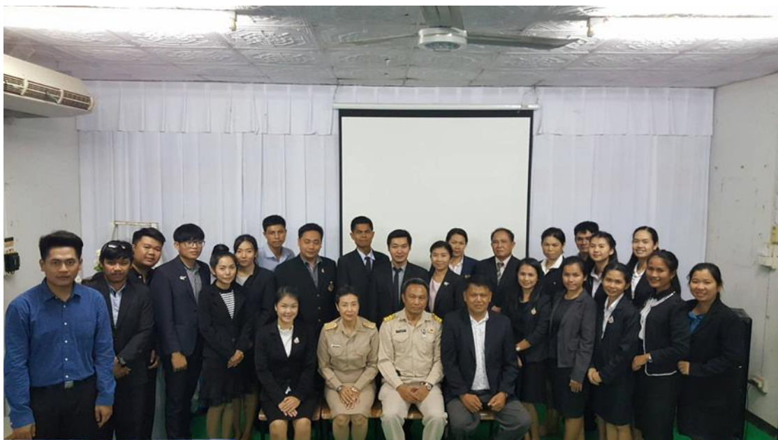
กิจกรรมสัมมนาและการสนทนากลุ่ม โรงเรียนมัธยมพื้นที่เขต ๑๙