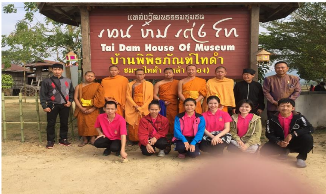
กิจกรรมนิสิตร่วมศึกษาชุมชนไทดำบ้านนาป่าหนาด อำเภอเชียงคาน