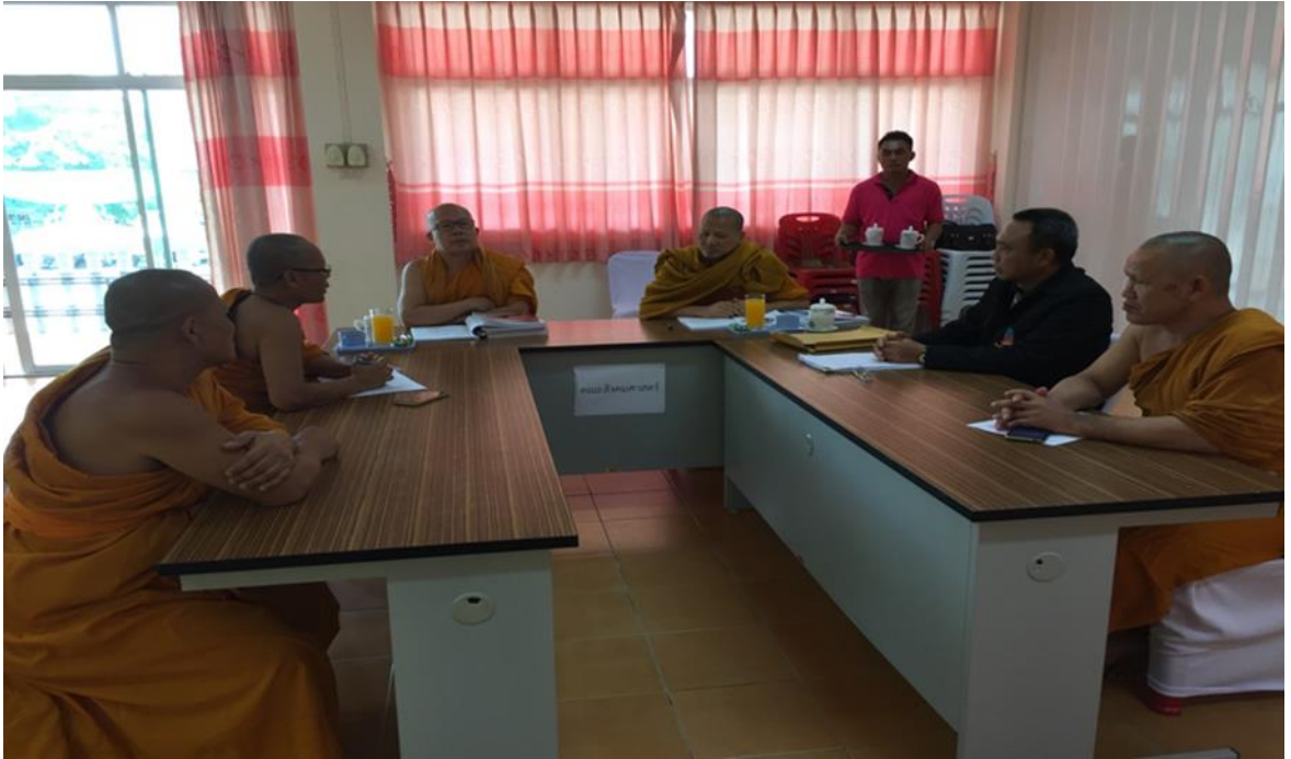
กิจกรรมสัมภาษณ์และการสนทนากลุ่ม โรงเรียนปริยัติธรรมแผนกสามัญ