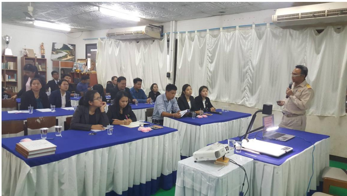
กิจกรรมสัมมนาและการสนทนากลุ่ม โรงเรียนมัธยมพื้นที่เขต ๑๙