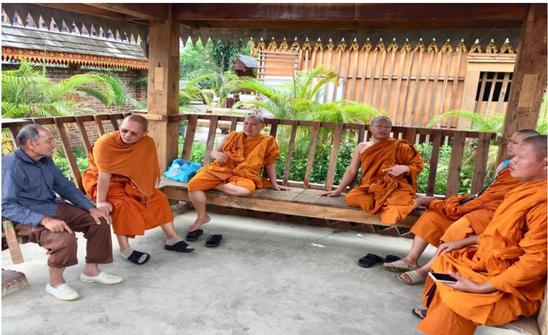
กิจกรรมสัมภาษณ์และการสนทนากลุ่ม โรงเรียนปริยัติธรรมแผนกสามัญ