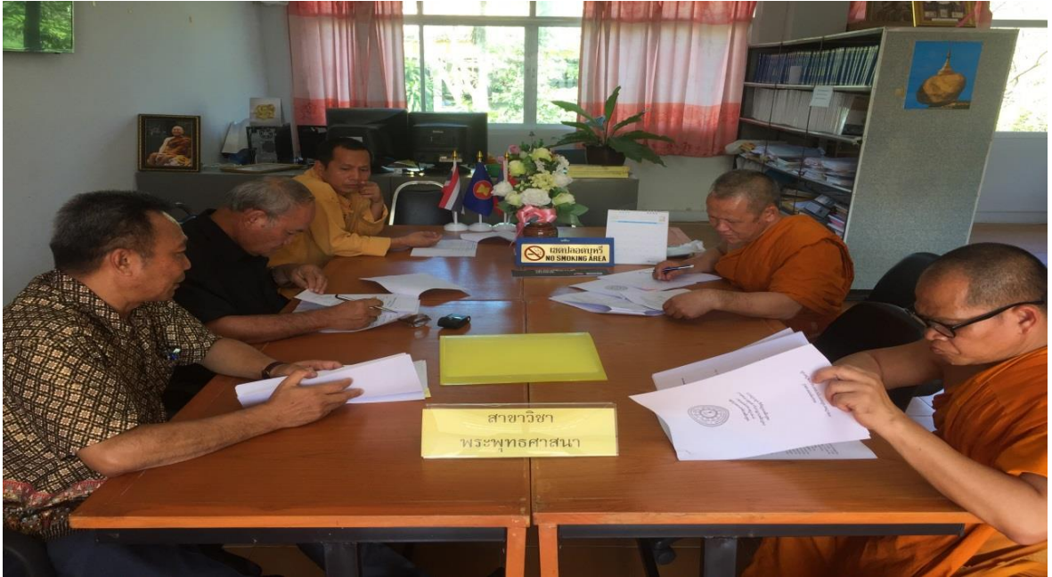
กิจกรรมสัมภาษณ์และการสนทนากลุ่ม วิทยาลัยสงฆ์เลย