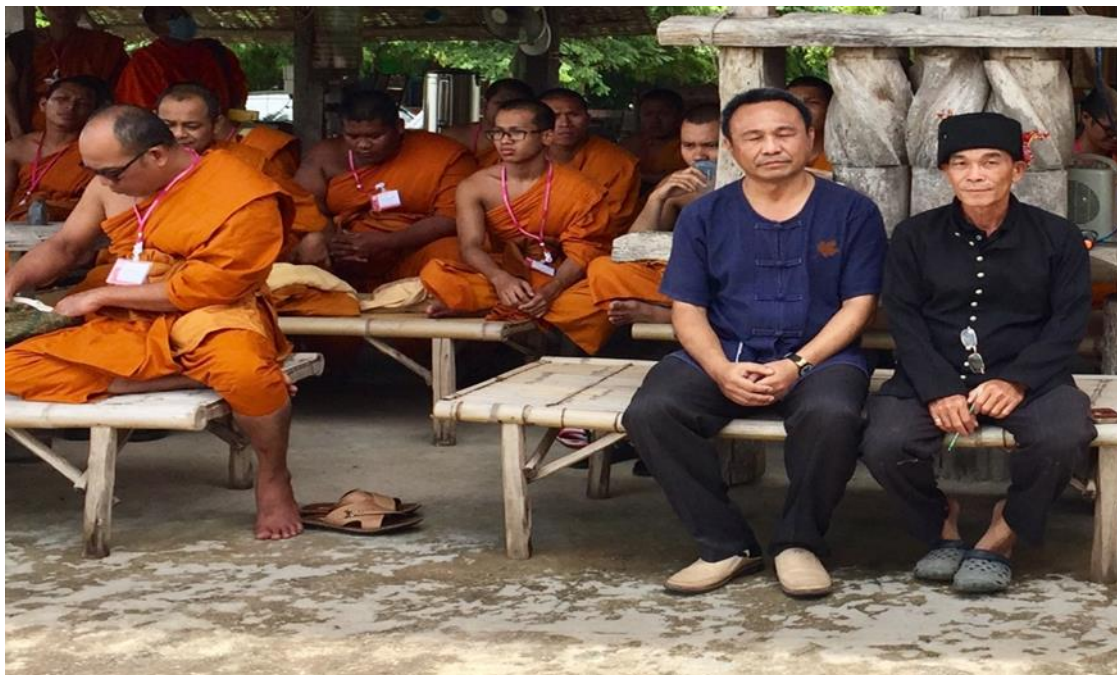
กิจกรรมนิสิตร่วมศึกษาชุมชนไทดำบ้านนาป่าหนาด อำเภอเชียงคาน