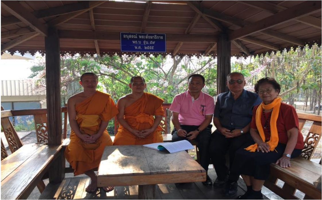
กิจกรรมสัมภาษณ์ผู้บริหาร โรงเรียนปริยัติธรรมแผนกสามัญ