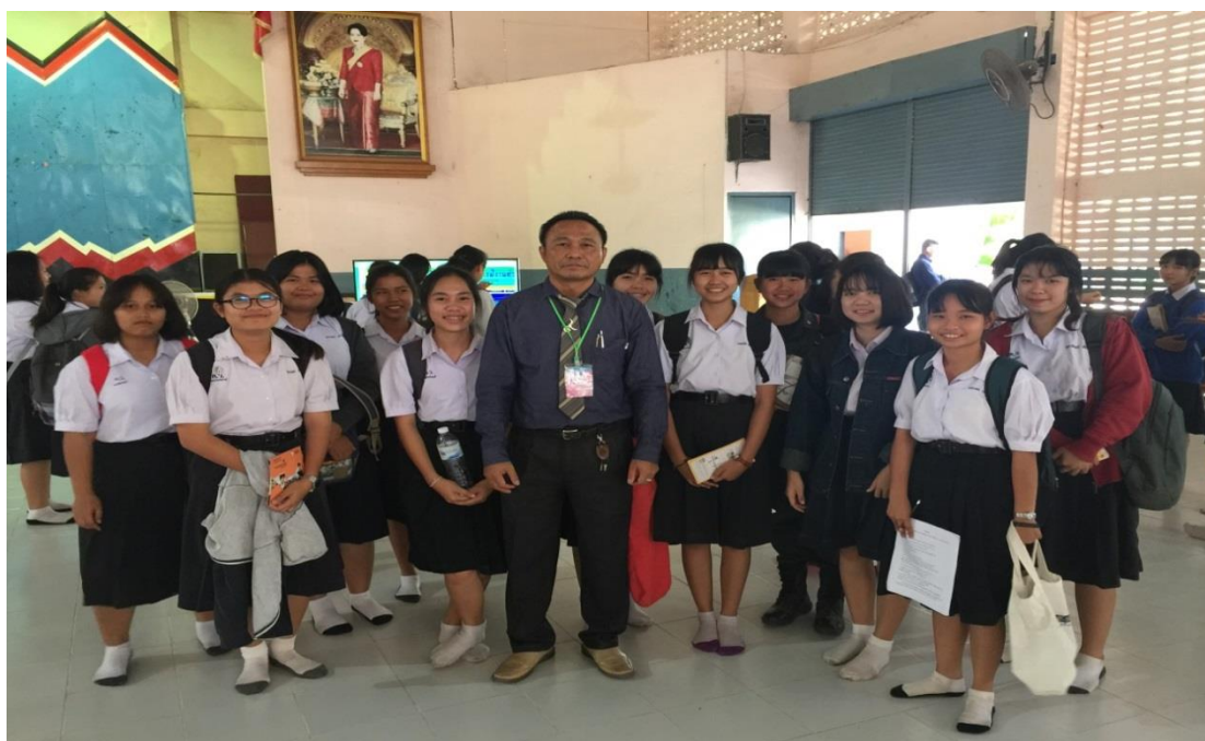
จัดกิจกรรมใช้สมุดบันทึกแห่งการทำความดี โรงเรียนนาอ้อ อำเภอมือเอย จังหวัดเลย