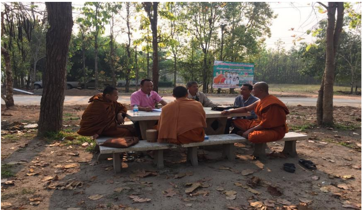
กิจกรรมสัมภาษณ์และการสนทนากลุ่ม โรงเรียนปริยัติธรรมแผนกสามัญ