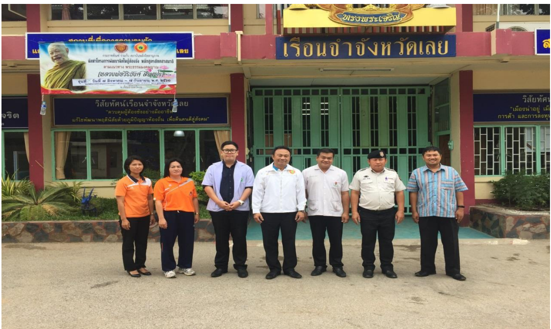
กิจกรรมสัมภาษณ์และการสนทนากลุ่ม เรือนจำจังหวัดเลย และวัฒนธรรมจังหวัดเลย