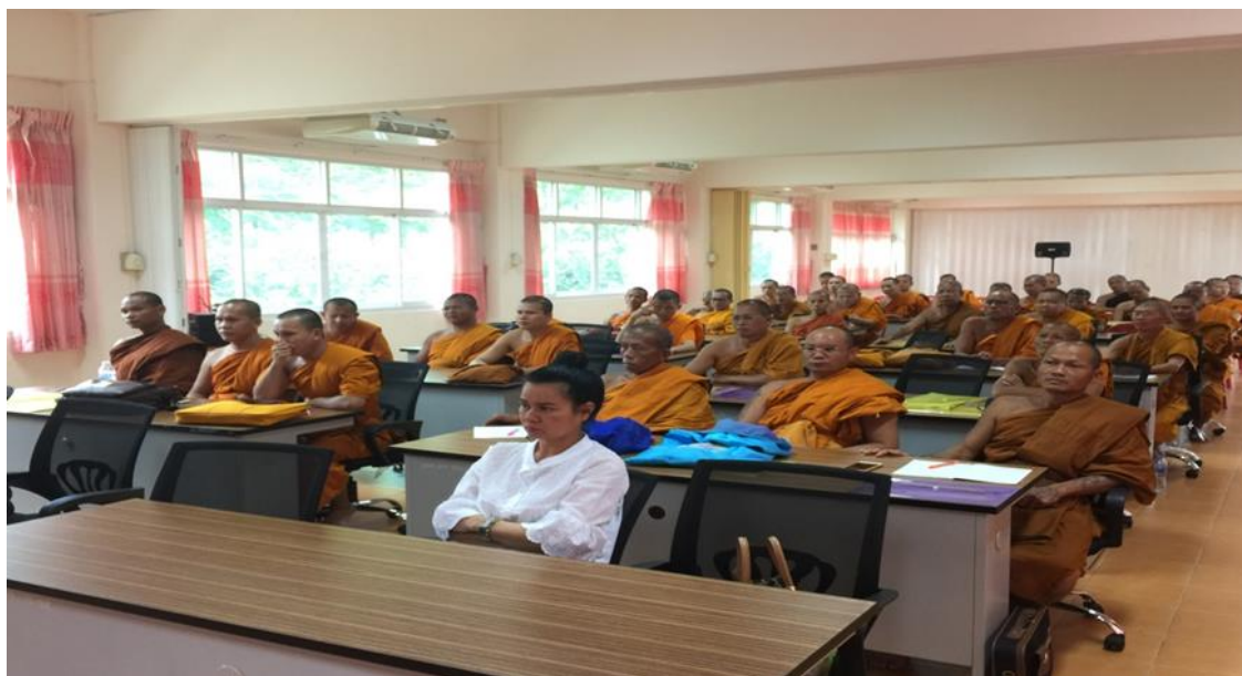
กิจกรรมใช้สมุดบันทึกแห่งการทำความดี ศรีจันทร์วิทยา (ปริยัติธรรมแผนกสามัญ)