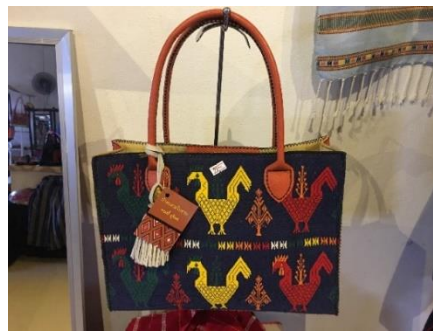
ภาพ แปรรูปเป็นกระเป๋าสุภาพสตรี