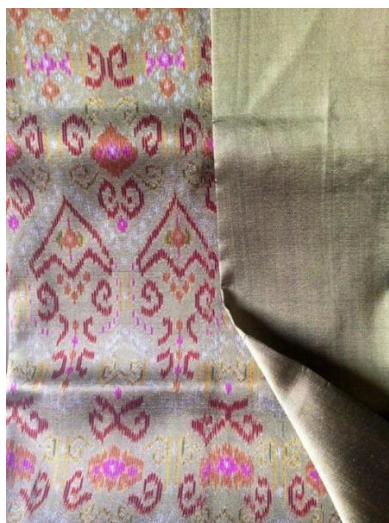
ภาพที่ ๔.๒ อุตสาหกรรมที่โดดเด่นผ้าทอมีลวดลายที่สวยงาม (ลายเปาบุ้นจิ้น)

สรุปผลจากการลงพื้นที่ศึกษาหลักการบริหาร กระบวนการส่งเสริม อุตสาหกรรมที่โดดเด่นผ้าทอของจังหวัดพิจิตรมีถ่ายทอดความรู้การทอผ้าพื้นเมืองจังหวัดพิจิตร มีการบริหารแบบกลุ่มระหว่างหมู่บ้านติดต่อประสานงานเพื่อจัดทำผ้าทอ และมีการส่งเสริมให้มีการเรียนการสอนโดยการให้กลุ่มคนที่สนใจเกี่ยวกับผ้าทอเข้าไปศึกษาและเลือกซื้อผ้าทอไทยได้ตามความต้องการ เริ่มต้นการศึกษาเรียนรู้ขั้นตอนการทอผ้าจากสถาบันครอบครัวที่ถ่ายทอดองค์ความรู้ต่าง ๆ จากคนรุ่นหนึ่งสู่คนอีกรุ่นหนึ่ง แม่และยายเป็นผู้สอนให้ทอผ้าให้หนึ่งคู่มือการทอช่างที่ทอผ้า ทำให้ดูแล้วให้ทำตามแบบ สาธิตทำทีละขั้นตอน และให้ลงมือปฏิบัติการทอผ้าจริงด้วยตนเอง เพื่อจะได้เกิดการเรียนรู้จากการลงมือปฏิบัติจริง เป็นการเรียนรู้ที่สามารถจดจำได้รวดเร็วและยาวนาน เมื่อปฏิบัติการทอผ้าซ้ำ ๆ ไปมาเป็นระยะเวลาานาน ๆ จนเกิดเป็นความชำนาญ ซึ่งมีผ้าที่เป็นอุตสาหกรรมที่โดดเด่น คือผ้าทอผ้าทอลายเปาบุ้นจิ้น อุตสาหกรรมที่โดดเด่นผ้าทอ ผ้าทอพื้นเมืองจังหวัดพิจิตร ลวดลายที่เป็นเอกลักษณ์ คือ ลายเปาบุ้นจิ้นแหล่งทอที่สำคัญการย้อมสี ควรแยกภาชนะการย้อมสีเพื่อป้องกันสีผสมกัน และต้องรักษาอุณหภูมิความร้อนของ น้ำต้มย้อมเส้นด้ายให้สม่ำเสมอ การมัดย้อมเส้นด้าย ควรมัดเส้นด้ายให้แน่น เพราะหากมัดไม่แน่นอาจจะทำให้สีย้อมกลืนเข้าหากัน จะทำให้ได้ลวดลายไม่สม่ำเสมอและไม่สวยงาม การทอผ้ามัดหมี่ ริมต้องเรียบเสมอกัน ตีพิมพ์ให้แน่นสม่ำเสมอ การทอลายมัดหมี่ ต้องหมั่นเรียนรู้และฝึกทักษะความชำนาญ เพื่อให้ได้ลวดลายที่ต่อเนื่อง และสม่ำเสมอ