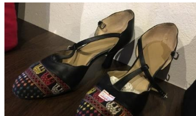
ภาพ แปรรูปเป็นผลิตภัณฑ์ต่างๆ ผ้าจีน สะเป ผ้าตีนจกลดตายหลากหลาย