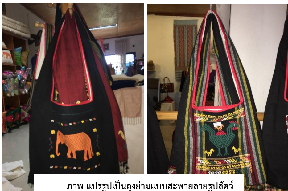
ภาพ แปรรูปเป็นถุงย่ามแบบสะพายลายรูปสัตว์