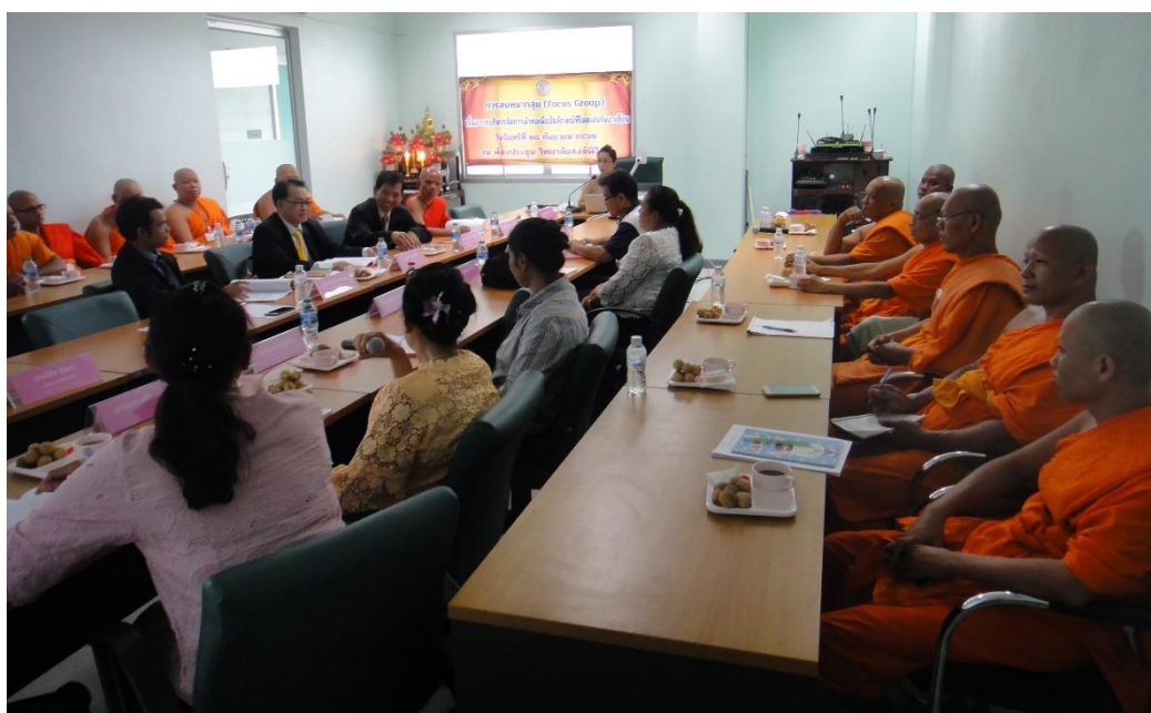
ภาพ ผู้ร่วมสนทนากลุ่ม