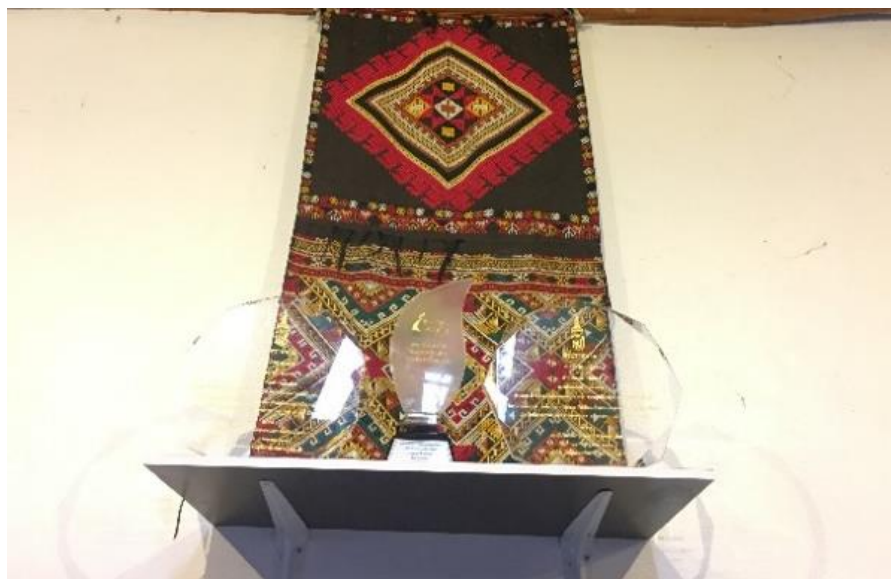
ภาพ รางวัลที่ได้รับจาก UNESCO และองค์กรต่างๆ