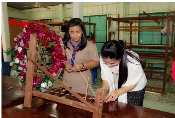
ภาพที่ ๔.๑ ขั้นตอนการลงสัมผัสภาพลักษณ์และปฏิบัติจริง

เคล็ดลับในการผลิตผ้าทอพื้นเมืองจังหวัดพิจิตร ลวดลายที่เป็นเอกลักษณ์ คือ ลายเปาบุ้นจิ้น แหล่งทอที่สำคัญ ๑) การย้อมสี ควรแยกภาชนะการย้อมสีเพื่อป้องกันสีผสมกลืนกัน และต้องรักษาอุณหภูมิความร้อนของ น้ำต้มสีย้อมเส้นด้ายให้สม่ำเสมอ ๒) การมัดย้อมเส้นด้าย ควรมัดเส้นด้ายให้แน่น เพราะหากมัดไม่แน่นอาจจะทำให้สีย้อมกลืนเข้าหากัน จะทำให้ได้ลวดลายไม่สม่ำเสมอและไม่สวยงาม ๓) การทอผ้ามัดหมี่ ริมต้องเรียบเสมอกัน ตีพืมให้แน่นสม่ำเสมอ ๔) การทอลายมัดหมี่ ต้องหมั่นเรียนรู้และฝึกทักษะความชำนาญ เพื่อให้ได้ลวดลายที่ต่อเนื่อง และสม่ำเสมอ