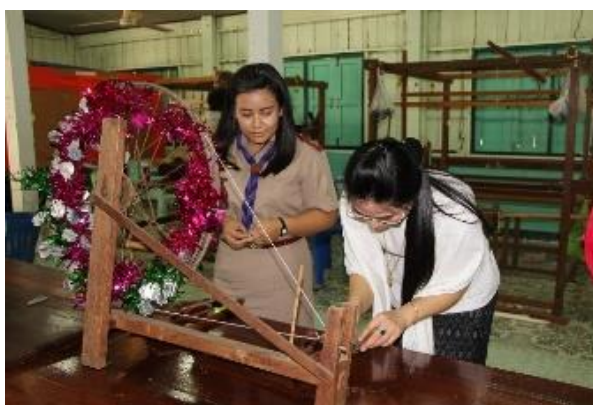
ภาพกระสวย และหลายอุปกรณ์ที่ใช้ในการทอผ้า