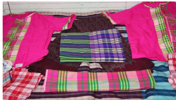
ภาพ แปรรูปเป็นเสื้อสำหรับนักเรียนประถม