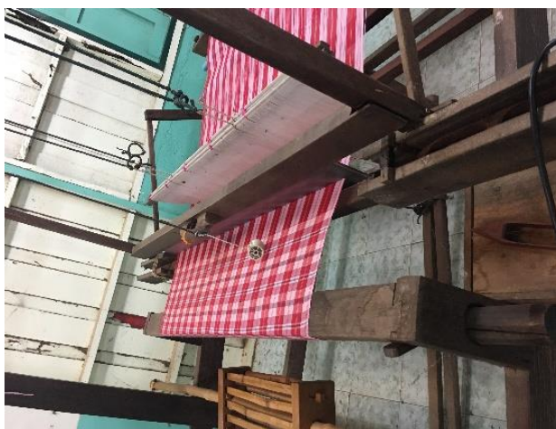
ภาพ ที่ทอผ้าใช้สำหรับถ่ายทอดองค์ความรู้สู่คนรุ่นใหม่ในโรงเรียนบ้านป่าแดง จังหวัดพิจิตร