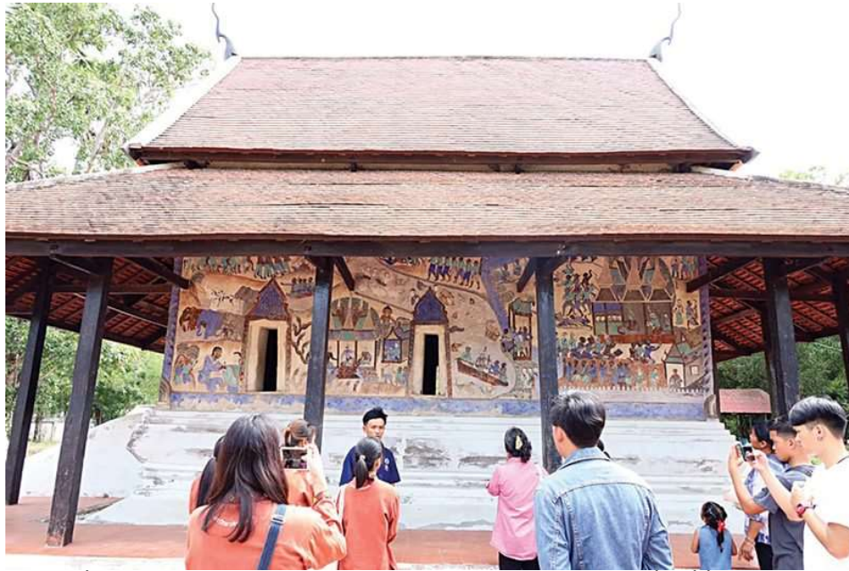
ภาพปราสาทท้องถิ่น (คุณพ่อเสถียร พุทโรสง) กำลังอธิบายเล่าเรื่องราวสุปแต่้มให้ผู้สนใจฟัง