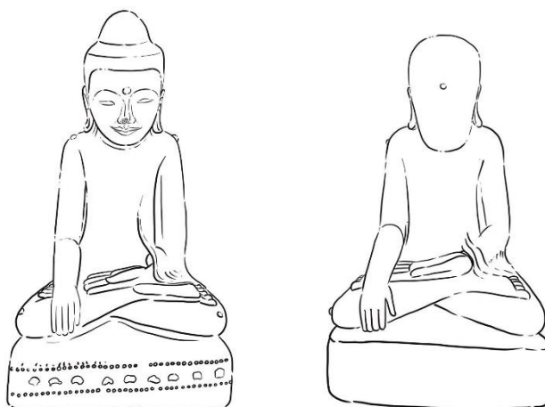
ภาพที่ 010/ 011 รูปแบบพระบัวเข็ม ที่แสดงปมบนตามร่างกายทั้ง 9 จุด ได้แก่ หน้าผาก 1 หัวไหล่ 2 ข้อศอก 2 หัวเข่า 2 และข้อเท้าหรือฝ่าเท้าอีก 2