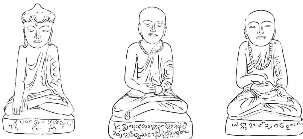
ภาพที่ 07/08/09 รูปแบบพระอุปัคต ที่แสดงด้วยใบบัว หรือการล้วงมือลงในบาตร หรือสัญลักษณ์ใบบัว ปลา และหอยใต้ฐาน