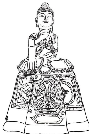
ภาพที่ 05/06 พระพุทธรูปนั่ง ไม่ทรงเครื่องกษัตริย์ โดดเด่นด้วยการดึงชายจีวรขึ้นบังอังสาขวา และปล่อยชายจีวรให้ตกลงมาจากอังสาซ้าย