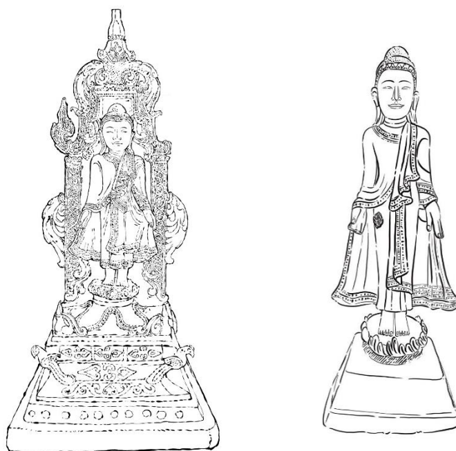
ภาพที่ 01/02 พระพุทธรูปยืน วัดป่าตุ่มดอน ในพระหัตถ์ซ้ายถือผลสมอ อาจหมายถึงพระพุทธรูปปางฉันทสมอ หรือพระไภษัชยคุรุก็ได้

ฮันส์ เพนธ์, 2519. คำจารึกที่ฐานพระพุทธรูปในนครเชียงใหม่ . กรุงเทพฯ: สำนักนายกรัฐมนตรี.