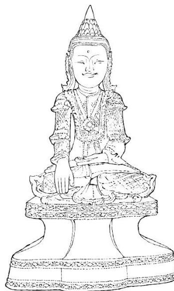
ภาพที่ 03/04 พระพุทธรูปนั่ง ทรงเครื่องกษัตริย์ สวมมงกุฎสูง กับสวมมกุฎเตี้ย ที่มา: ศิววงศ์ รักรวงศ์วิริศ