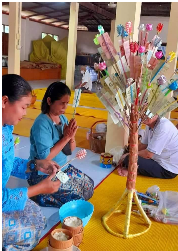
ทอดผ้าป่าสามัคคีสมทบกองทุนแม่ของแผ่นดิน ถวายเป็นพระราชกุศล