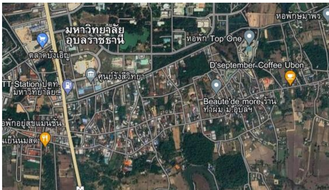
ภาพที่ ๔.๑ แผนที่บ้านศรีโคอก เทศบาลตำบลเมืองศรีโค

บ้านศรีโคอก ตั้งอยู่ตำบลเมืองศรีโค อำเภวารินชำราบ จังหวัดอุบลราชธานี มีพื้นที่ หมู่บ้านทั้งหมด ๒,๒๗๒ ไร่ เป็นพื้นที่ที่ใช้ทำการเกษตร ๑,๘๐๐ ไร่ โดยเกษตรกรส่วนใหญ่ใช้ทำนาปี ละครั้งหรือที่เรียกว่านาปี หลังจากฤดูกาลทำนาเกษตรกรจะเพาะปลูกพืชฤดูแล้ง ประกอบด้วย ข้าวโพดเลี้ยงสัตว์ ข้าวโพดหวาน กระหล่ำปลี ถั่วเขียว งาม สารระแห่น มะเขือ พริก ถั่วฝักยาว และปอ เทือง เป็นต้น บ้านศรีโคอก มีครัวเรือนทั้งสิ้น จำนวน ๒๔๙ ครัวเรือน (รวมหอพัก) ประชากรทั้งหมด ๘๘๙ คน แบ่งออกเป็น ชาย ๔๖๕ คน และหญิง ๔๒๔ คน สภาพภูมิประเทศเป็นที่ราบลุ่ม เหมาะ สำหรับการทำนา การปลูกพืชไร่ พืชสวน ด้านศาสนาและวัฒนธรรม บ้านศรีโคอกมี วัด ๑ แห่ง คือ วัดบ้านศรีไควราวาส เป็นศูนย์รวมจิตใจของชาวบ้าน มีพระสงฆ์ จำนวน ๕ รูป และสามเณร ๑ รูป ซึ่ง ชาวบ้านส่วนใหญ่นับถือพระพุทธศาสนา โดยมีวัฒนธรรมการทำบุญตลอด ๑๒ เดือนแบบอีสานแท้ บ้านศรีโคอกเป็นสถานที่ตั้งของมหาวิทยาลัยอุบลราชธานี โดยในเขตบ้านศรีโคอก ไม่มีสถานศึกษา ขึ้นพื้นฐาน ประชาชนมีรายได้เฉลี่ยต่อหัวคนละ ๓๒,๐๐๐ บาท ต่อคน/ปี (จปฐ ปี ๒๕๖๓) ซึ่งรายได้ ส่วนใหญ่มาจากการประกอบอาชีพทำนา ๑๒๕ ครัวเรือน เลี้ยงสัตว์ ๑๕ ครัวเรือน รับจ้าง ๔๖ ครัวเรือน ค้าขาย ๓๕ ครัวเรือน อาชีพช่างต่าง ๆ ๑๔ ครัวเรือน และอาชีพอื่น ๆ ๗ ครัวเรือน