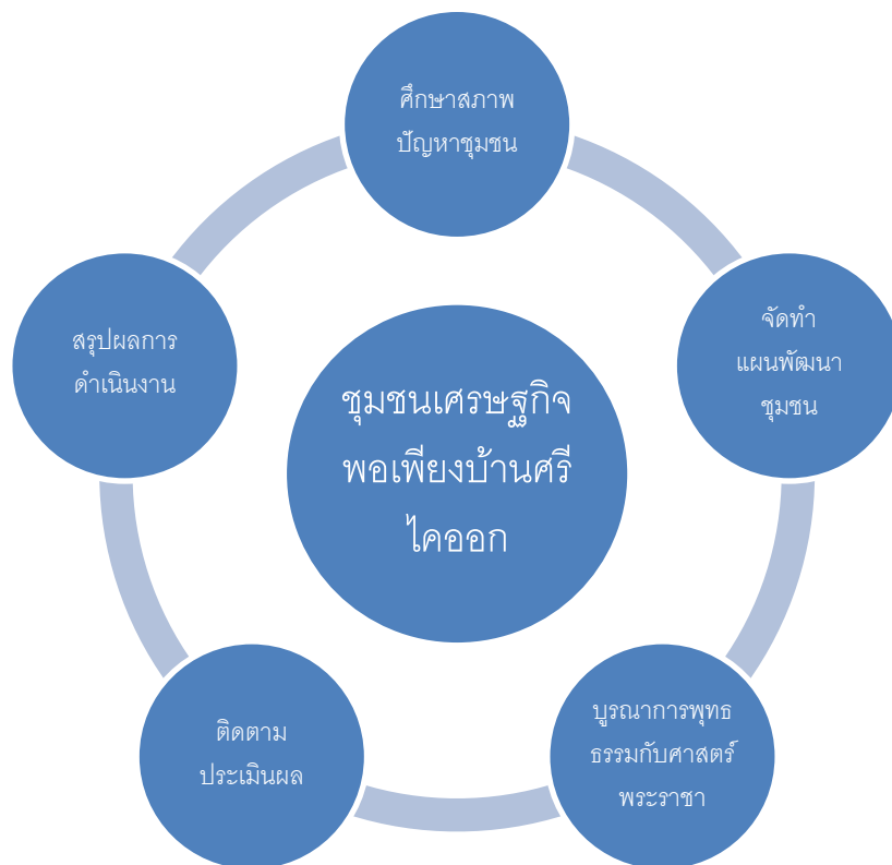
ภาพที่ ๔.๒ กระบวนการพัฒนาชุมชนเศรษฐกิจพอเพียง บ้านศรีไคออก

จากแผนภาพที่ ๔.๒ กระบวนการพัฒนาชุมชนเศรษฐกิจพอเพียง หมู่บ้านศรีไคออก ตำบลเมืองศรีไค อำเภวารินชำราบ จังหวัดอุบลราชธานี มีดังต่อไปนี้คือ