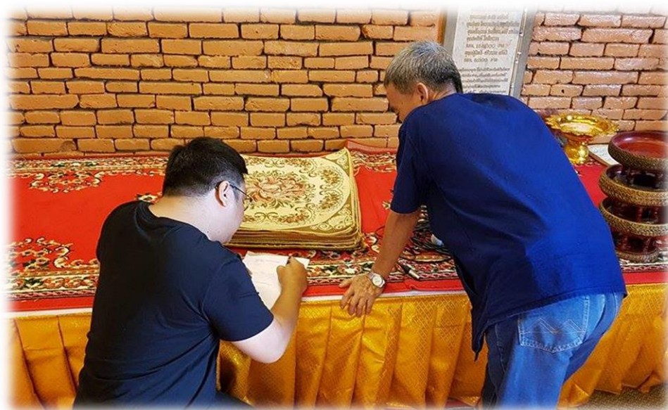
การลงพื้นที่เก็บข้อมูลการวิจัย ณ วัดพระธาตุนาเวง อำเภอเชียงแสน จังหวัดเชียงราย