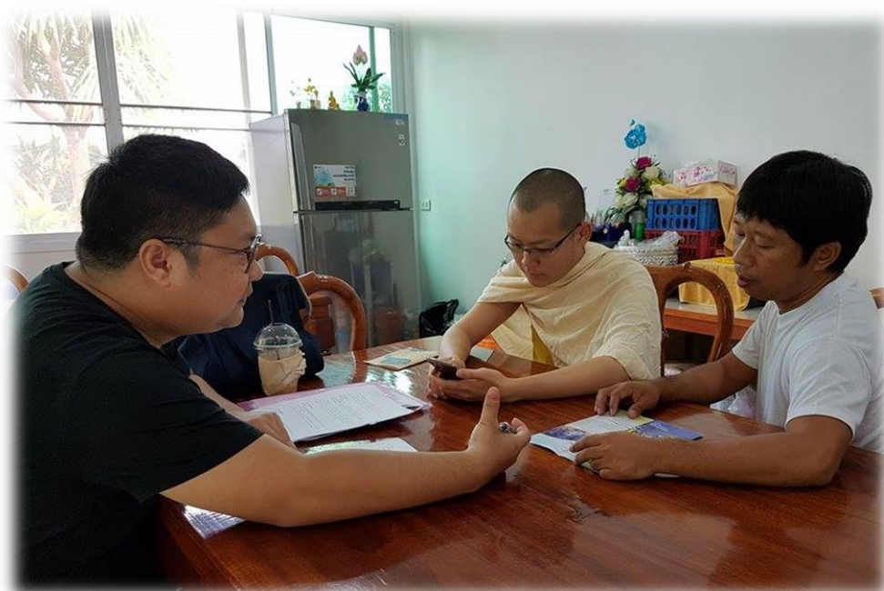
การลงพื้นที่เก็บข้อมูลการวิจัย ณ วัดร่องเสือเต้น อำเภอเมือง จังหวัดเชียงราย