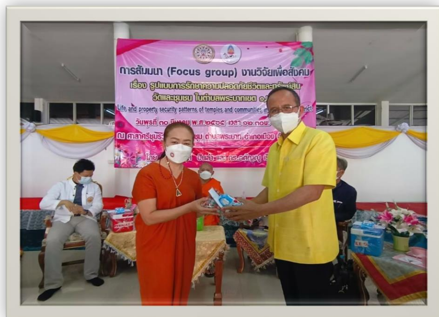
มอบของที่ระลึกให้แก่ ผู้นำชุมชน พิธีกร