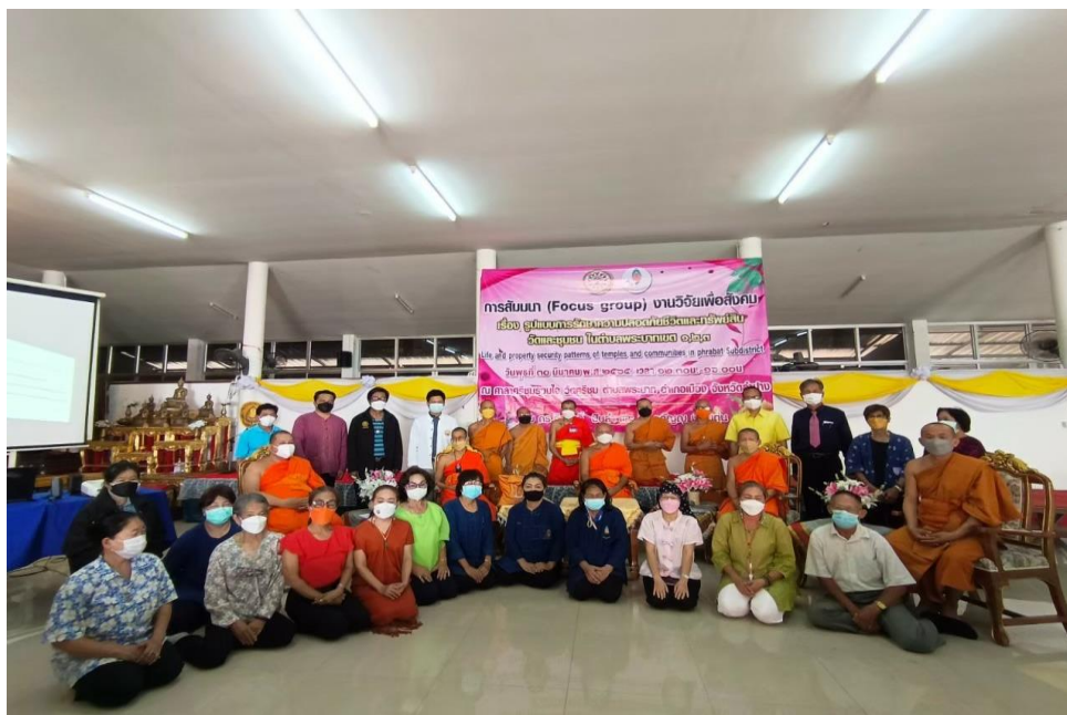
ภาพหมู่หลังจากการสัมมนา ณ ศาลาศรีชุมรวมใจ วัดศรีชุม อำเภอเมืองลำปาง จังหวัดลำปาง ๓๐ มีนาคม ๒๕๖๕