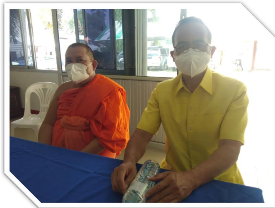
ท่านพระครูสุตชยาภรณ์,ผศ.ดร. เจ้าของสถานที่ วัดศรีชุม จัดการสัมมนา อำนวยความสะดวก