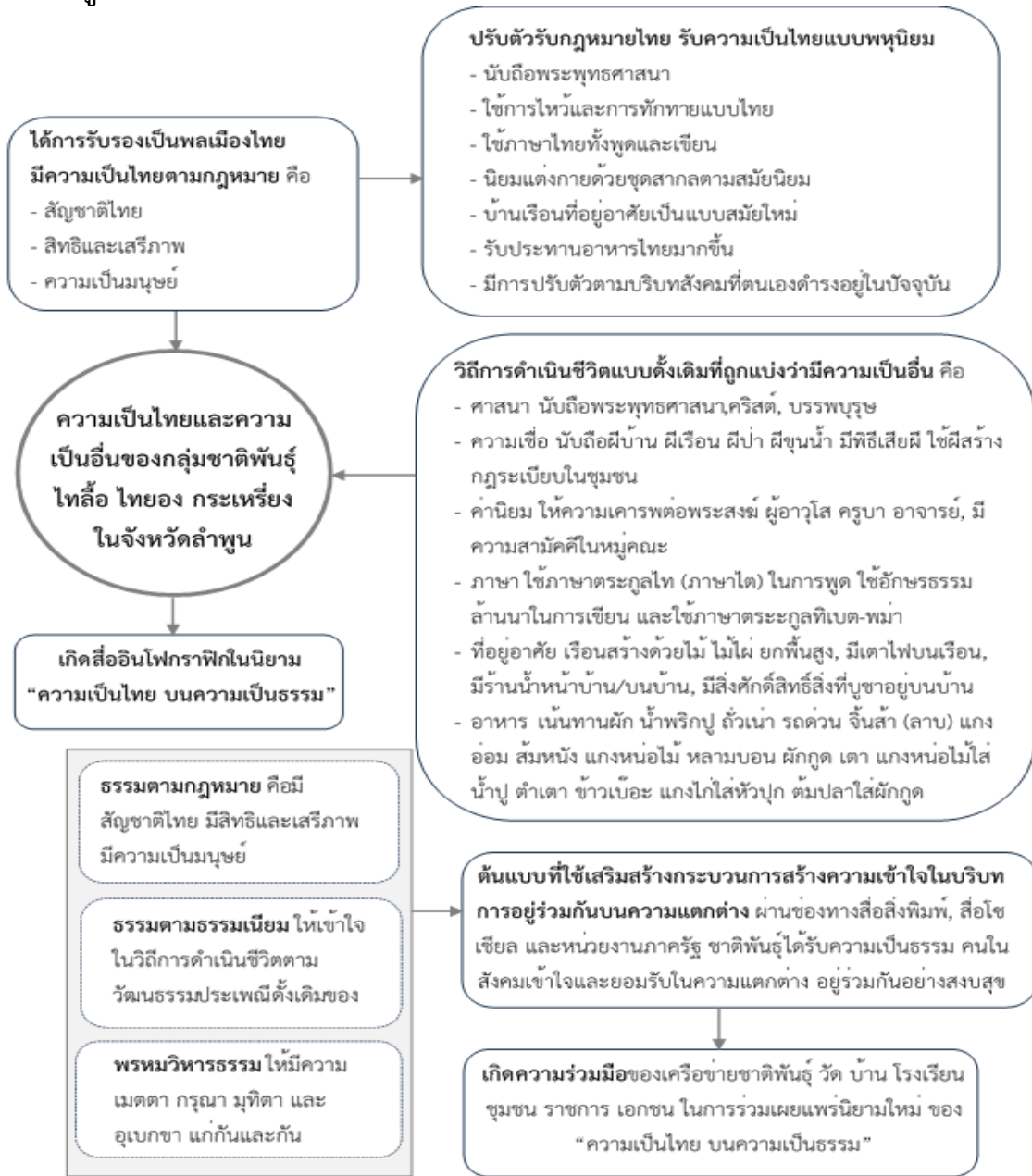
Figure 1: The New Body of Knowledge

การศึกษาวิจัยนี้ ผู้วิจัยค้นพบองค์ความรู้คือ เริ่มจากการที่กลุ่มชาติพันธุ์อพยพเข้ามาอาศัยในประเทศไทยด้วยภัยสงคราม ได้รับสัญชาติไทย ดำเนินชีวิตภายใต้กรอบของกฎหมายไทย รับวัฒนธรรมของไทย ปรับตัวตามสภาพแวดล้อมที่อยู่อาศัยใหม่ แต่คนในสังคมยังคงมองวิถีการดำเนินชีวิตแบบดั้งเดิมที่ถูกแบ่งแยกว่ามีความเป็นอื่น ในความเป็นอื่นที่ถูกแบ่งนั้น คือ ความแตกต่างในทางความเชื่อ ภาษา ที่อยู่อาศัย อาหาร เป็นต้น จากการสังเคราะห์ความรู้จึงนำไปสู่การระดมความคิดเห็นในการสร้างสื่อเพื่อใช้เป็นเครื่องมือในการทำความเข้าใจกับคนในสังคมผ่านนิสิตกลุ่มที่เป็นชาติพันธุ์ไทลื้อ ไทยอง กระเหรี่ยง ทำให้ทราบว่าชาติพันธุ์คนรุ่นใหม่มีความภูมิใจในความเป็นชาติพันธุ์ของตนเอง การนำเสนอความเป็นตนเองนั้นควรส่งผ่านด้านเครื่องแต่งกายที่เกิดจากภูมิปัญญาของตน รวมถึงการแสดงออกในวิถีความเชื่อด้านศาสนา และนำหลักธรรมไปใช้ในการดำเนินชีวิต ส่วนเครื่องมือที่เห็นว่ามีเหมาะสมต่อการสื่อสารคือ การจัดทำสื่อ