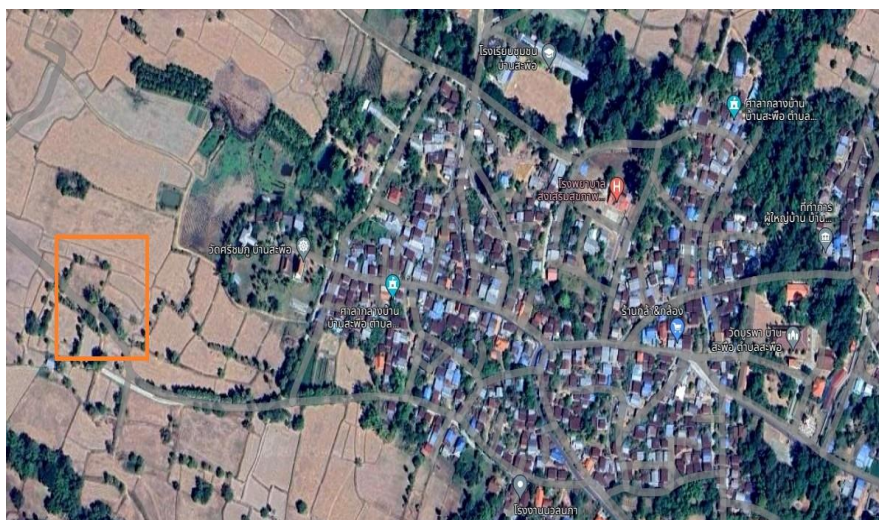
ภาพ พื้นที่ “ศึกษกบถโนนโพธิ์”

ท่านพระครูสถิตบุรพาภิวัฒน์ (บุญเวียน) เจ้าอาวาสวัดบุรพาราม บ้านสะพือ และพระอธิการพีระพงษ์ วีรสโร เจ้าอาวาสวัดทุ่งศรีทิวผล หมู่ที่ ๗ กล่าวว่าได้มีการดำริที่จะสร้างเป็นแหล่งการเรียนรู้ โดยพยายามรวบรวมทางประวัติศาสตร์ครั้งนั้นไว้ให้มากที่สุด ๑ ซึ่งในปัจจุบันได้มีการแบ่งพื้นที่ไว้ในการจัดการประมาณ ๑ ไร่