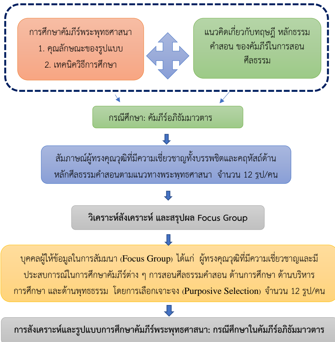
แผนภูมิที่ 1 แสดงกรอบแนวคิดในการวิจัย

งานวิจัยเรื่อง รูปแบบการศึกษาคัมภีร์พระพุทธศาสนา: กรณีศึกษาในคัมภีร์อภิธัมมวาร โดยผู้วิจัยได้ศึกษาค้นคว้าข้อมูลคัมภีร์จากพระไตรปิฎก เอกสาร บทความ ทฤษฎีและงานวิจัยที่เกี่ยวข้อง สรุปเป็นแนวคิดในการวิจัย (Conceptual Framework) ดังนี้