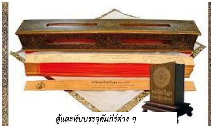
ตู้และหีบบรรจุคัมภีร์ต่าง ๆ

หลักธรรมคำสอนทางพุทธศาสนา ในยุคก่อนจะบันทึกเป็นลายลักษณ์อักษร ใช้วิธีท่องจำ (มุขปาฐะ) โดยใช้วิธีการแบ่งให้สงฆ์หลาย ๆ กลุ่มรับผิดชอบท่องจำในแต่ละเล่ม เป็นเครื่องมือช่วยในการรักษาความถูกต้องของหลักคำสอน จวบจนได้ถือกำเนิดอักษรเขียนที่เลียนแบบเสียงเกิดขึ้นมาซึ่งสามารถรักษาความถูกต้องของคำสอนเอาไว้