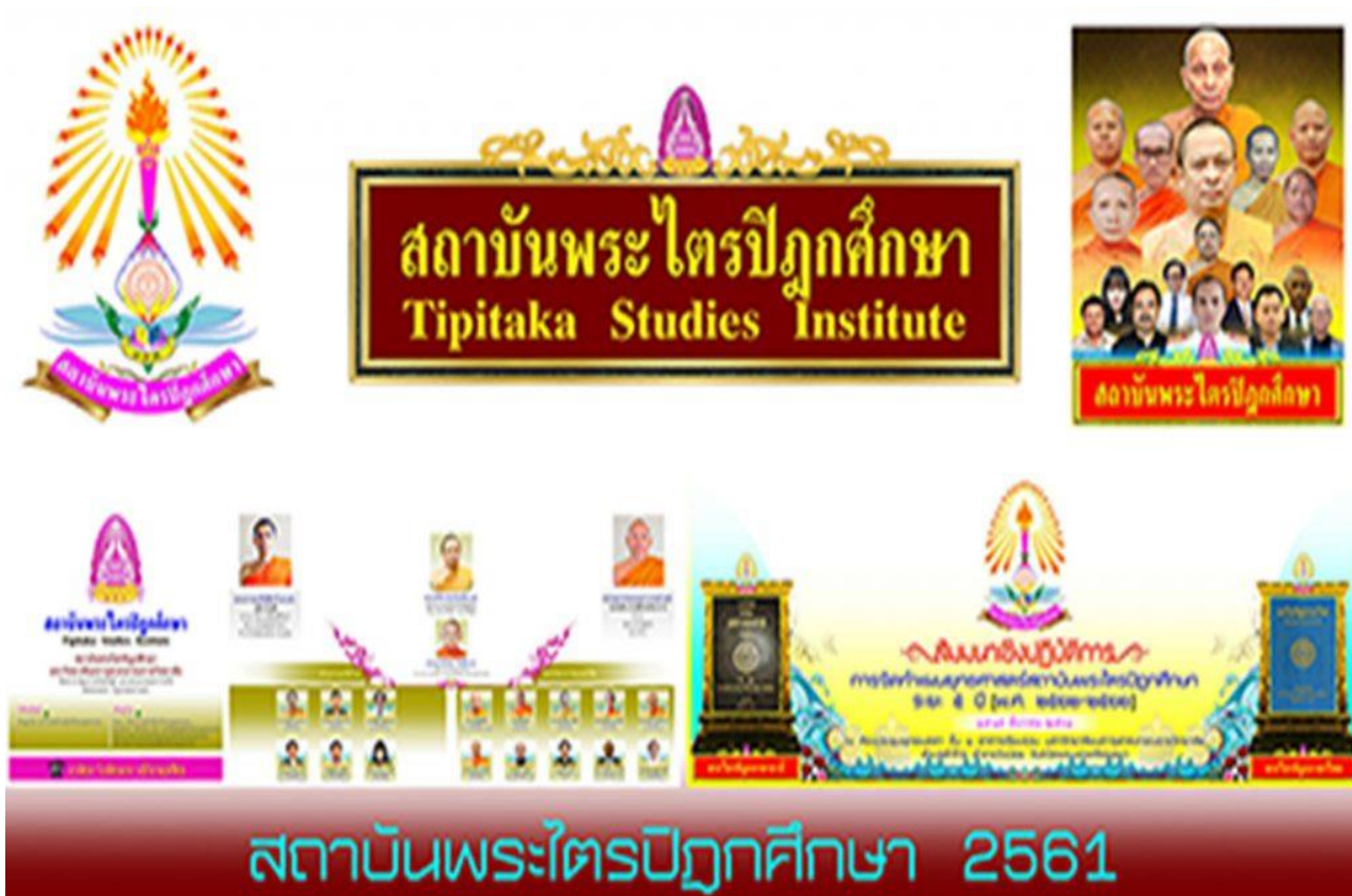
ตารางภาพที่ 3 สถาบันพระไตรปิฎกศึกษา