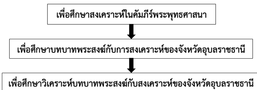
ภาพที่ ๓.๒ วัตถุประสงค์ของการวิจัย

การนำเสนอผลการศึกษาวิจัยจะเป็นการนำเสนอข้อมูลในลักษณะการพรรณนาความ (Descriptive Presentation) ประกอบฐานข้อมูล ภาพถ่ายกิจกรรม และการพรรณนาความ ประกอบการบรรยายข้อเท็จจริงที่เกิดขึ้นเชิงพื้นที่ ที่เกี่ยวกับ พุทธศาสตร์สงเคราะห์ บทบาทของพระสงฆ์ในจังหวัดอุบลราชธานี ตามวัตถุประสงค์ของการวิจัย ดังภาพนี้