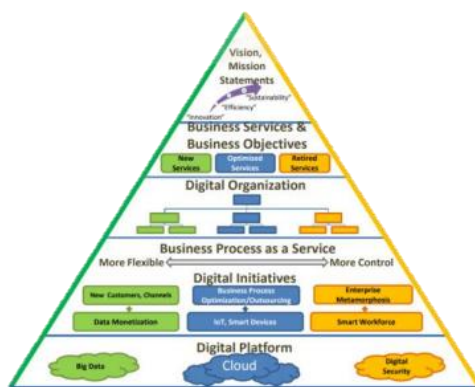
รูปภาพ 2.1 โมเดลการเปลี่ยนแปลงองค์กรสู่ยุคดิจิทัล โดยคุณต้นยรรูฐ