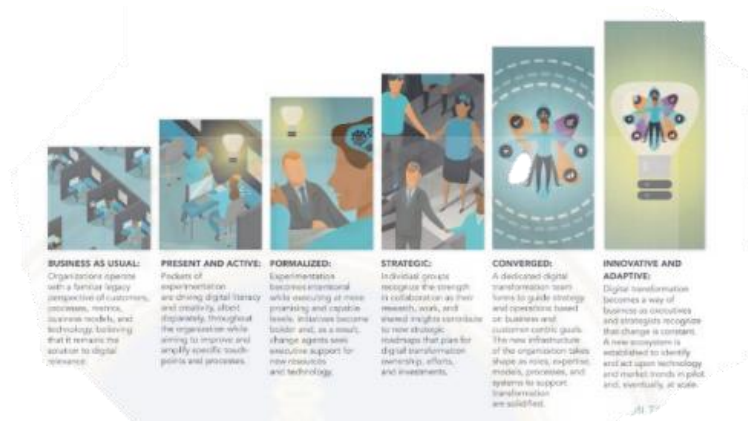
รูปภาพ 2.2 สถานการณ์เปลี่ยนแปลงองค์กรสู่ยุคดิจิทัลขององค์กร

สถานะช่วงที่ 1 – ทำธุรกิจตามปกติ เป็นสถานะเน้นการทำงานตามปกติอาจมีการลงทุนด้านเทคโนโลยีดิจิทัลเล็กน้อยเพื่อให้กระบวนการทำงานในปัจจุบันเดินไปอย่างมีประสิทธิภาพและธุรกิจสามารถดำเนินต่อไปได้ แต่ยังไม่มีความสำคัญในการเปลี่ยนแปลงองค์กร และยังขาดความเชื่อมโยงระหว่างเทคโนโลยีกับภาพรวมของธุรกิจอยู่