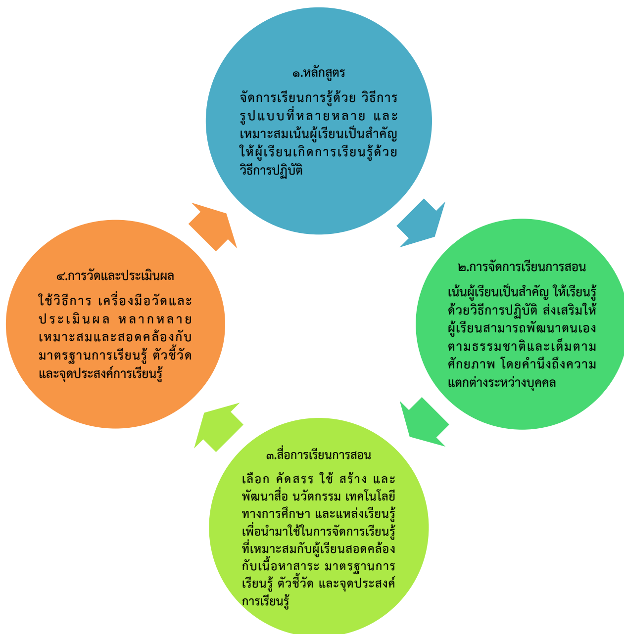
ภาพที่ ๑ แนวทางการจัดการศึกษาโรงเรียนพระปริยัติธรรม แผนกสามัญศึกษา จังหวัดอุบลราชธานี