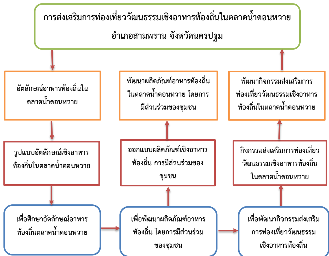
แผนภาพที่ ๑.๑ การแสดงกรอบในการวิจัย

ในการทำวิจัยเรื่องนี้ ผู้วิจัยได้นำแนวคิด ทฤษฎี เอกสาร งานวิจัยที่เกี่ยวข้อง นำมาสรุปเป็นกรอบแนวคิดในการวิจัยได้ดังนี้