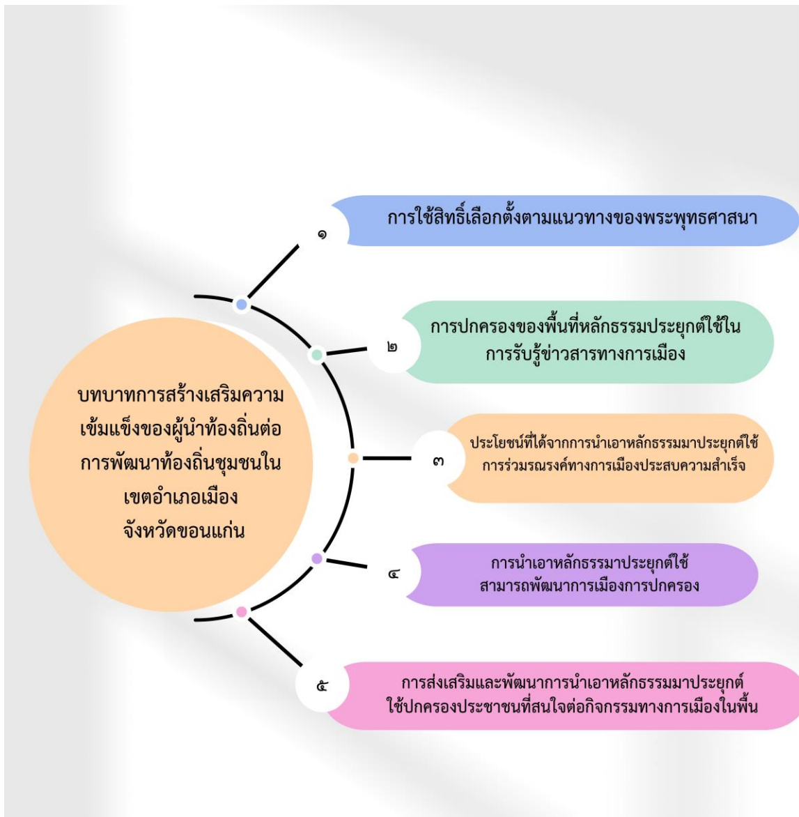
แผนภาพที่ ๔.๑ Model สรุปบทบาทการสร้างเสริมความเข้มแข็งของผู้นำท้องถิ่นต่อการพัฒนาท้องถิ่นชุมชนในเขตอำเภอเมืองขอนแก่น จังหวัดขอนแก่น

สรุปประเด็นคำถามบทบาทการสร้างเสริมความเข้มแข็งของผู้นำท้องถิ่นต่อการพัฒนาท้องถิ่นชุมชนในเขตอำเภอเมืองขอนแก่น จังหวัดขอนแก่น การวิจัยเชิงคุณภาพ (Qualitative Research) โดยการสัมภาษณ์เชิงลึก (In-depth Interviews) บทบาทการสร้างเสริมความเข้มแข็งของผู้นำท้องถิ่นต่อการพัฒนาท้องถิ่นชุมชนในเขตอำเภอเมืองขอนแก่น จังหวัดขอนแก่นรูปแบบ Model