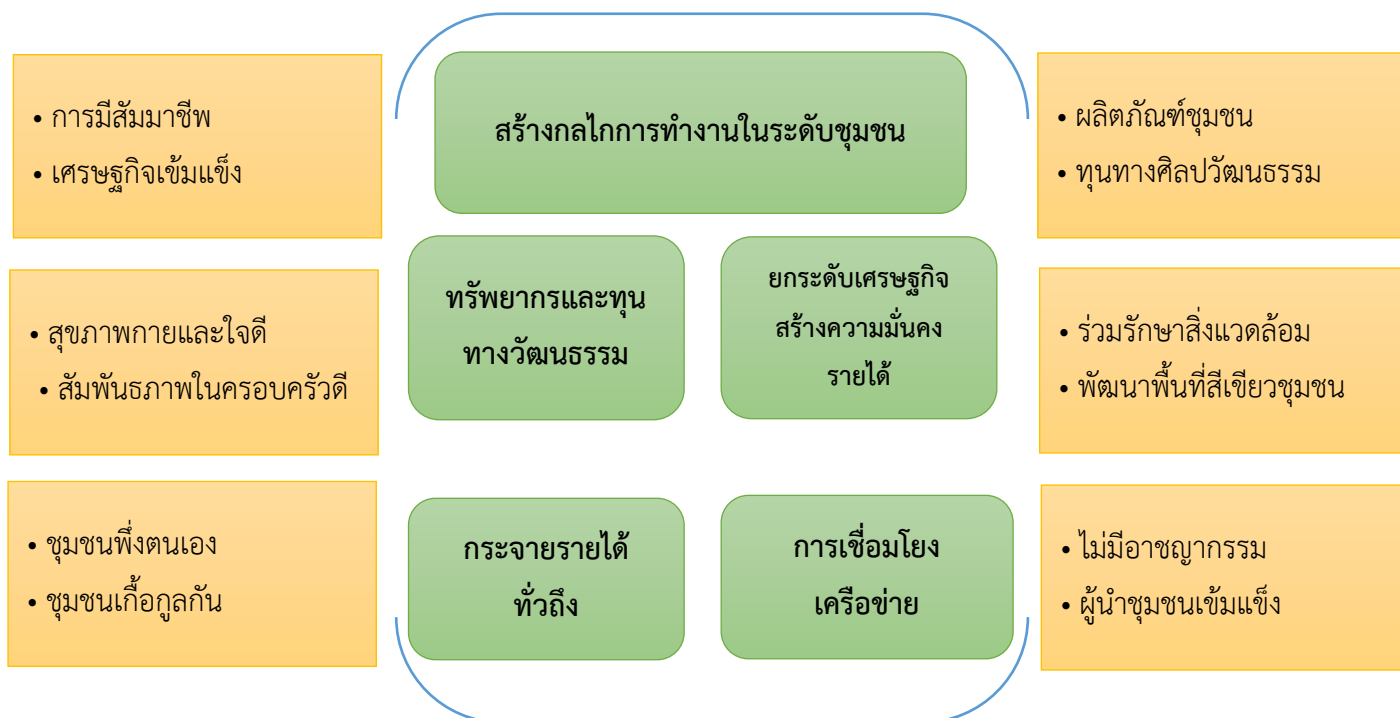
ภาพที่ ๔.๒ สรุปองค์ความรู้ที่ได้จากการวิจัย