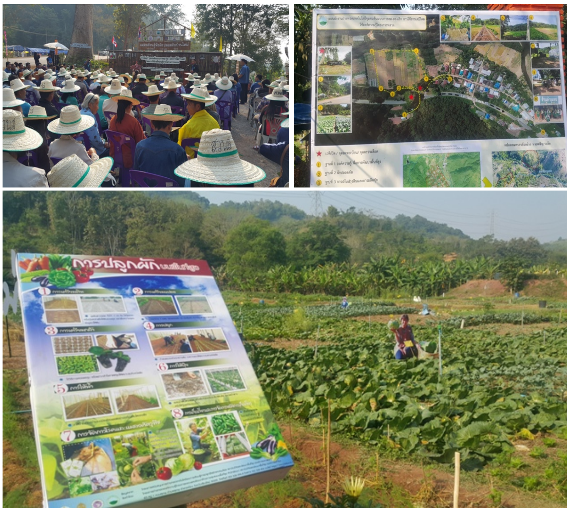
ภาพที่ ๔.๑ กิจกรรมการเสริมสร้างความมั่นคงทางเศรษฐกิจแก่คนในชุมชน

๔. การดำเนินกิจกรรม พบว่า มีการดำเนินกิจกรรมในแลกเปลี่ยนเรียนรู้ การเป็นชุมชนต้นแบบ เพื่อทำความเข้าใจและการศึกษาปัญหาของชุมชน พบว่า ชุมชนมีรายได้ไม่เพียงพอกับรายจ่าย ไม่รู้จักการออมที่ถูกต้องวิธีผู้วิจัยศึกษาและร่วมกันวางแผนการพัฒนาชุมชน จากการวางแผนได้จัดกิจกรรมเชิงปฏิบัติการเพื่อพัฒนา มีกิจกรรม ดังนี้