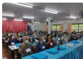
ภาพประกอบที่ ๔.๖ การร่วมกิจกรรมสร้างสรรค์เพื่อผู้สูงอายุตำบลกาญจนา โรงเรียนผู้สูงอายุ