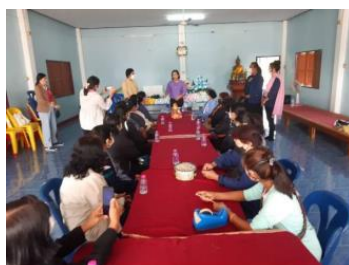
ภาพประกอบที่ ๔.๗ การฝึกอาชีพหลักสูตรระยะสั้น (การปักลายผ้า) กลุ่มสตรีในเขตองค์การบริหาร ส่วนตำบลกาญจนา อำเภอเมืองแพร่ จังหวัดแพร่

ด้านการเสริมสร้างความเข้มแข็งของชุมชนและความปลอดภัยในชีวิตและทรัพย์สิน พบว่า ประชาชนได้มีบทบาทในการร่วมกิจกรรมประเพณีลอยกระทง ประจำปี กับราชภัฏอุตรดิตถ์ (เขตแพร่) ผู้นำท้องที่ โรงเรียนวัดกาญจนาราม โรงพยาบาลส่งเสริมสุขภาพตำบลกาญจนา กลุ่มแม่บ้าน กลุ่มหนุ่มสาว และประชาชน, นอกจากนี้ยังได้ร่วมอบรมอาสาสมัครป้องกันภัยฝ่ายพลเรือน