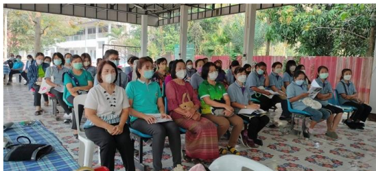
ภาพประกอบที่ ๔.๕ การอบรมโครงการส่งเสริมการออกกำลังกายในชุมชนลดความเสี่ยงโรคเรื้อรัง

คณะกรรมการกองทุนหลักประกันสุขภาพองค์การบริหารส่วนตำบลกาญจนนา และอนุมัติงบประมาณโครงการที่ขอรับการสนับสนุน ๕๓ นอกจากนี้ยังได้ร่วมอบรมโครงการส่งเสริมการออกกำลังกายในชุมชนลดความเสี่ยงโรคเรื้อรัง ๕๔