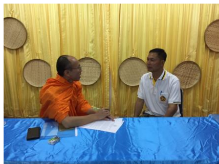
ภาพประกอบที่ ๔.๔ การสัมภาษณ์ผู้ให้ข้อมูลหลัก