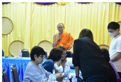
ภาพประกอบที่ ๔.๑๑ การลงพื้นที่ปฏิบัติการอบรม