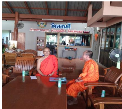
ภาพประกอบที่ ๔.๑ การสัมภาษณ์ผู้ให้ข้อมูลหลัก