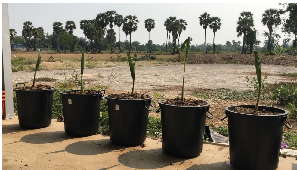
ภาพที่ ๔.๙ บอนไชตาล