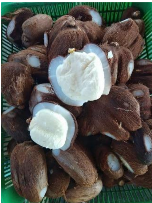
ภาพที่ ๔.๒ จาวตาล