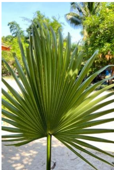
ตามภาพที่ ๔.๖ ใบตาล