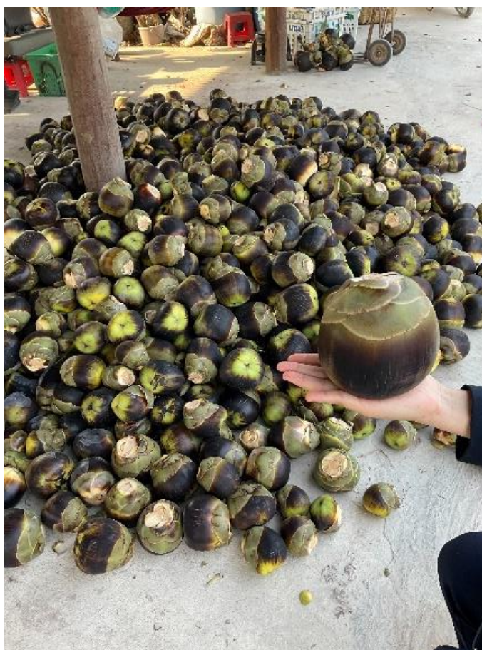
ภาพที่ ๔.๓ ผลตาล