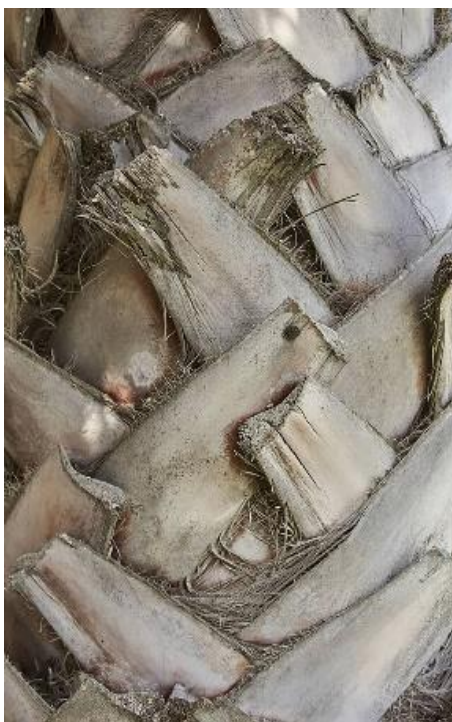
ตามภาพที่ ๕.๔ เปลือกตาล