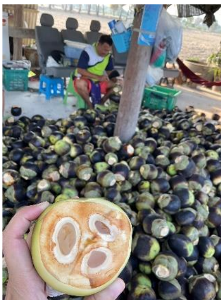
ภาพที่ ๔.๑ ลูกตาล