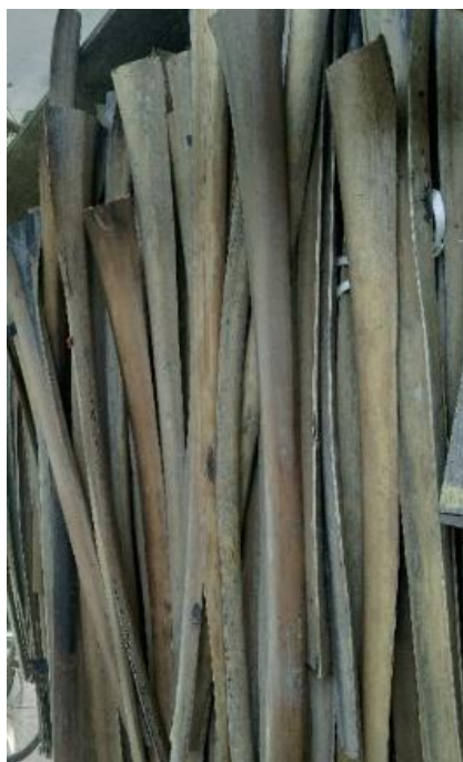
ภาพที่ ๔.๗ ทางตาล