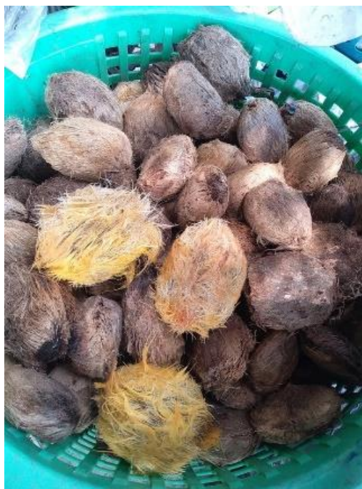
ตามภาพที่ ๔.๔ เมล็ดตาล