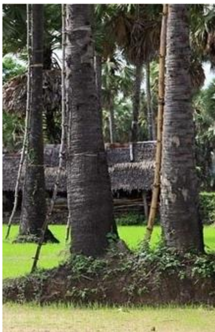
ภาพที่ ๔.๘ ลำต้นตาล