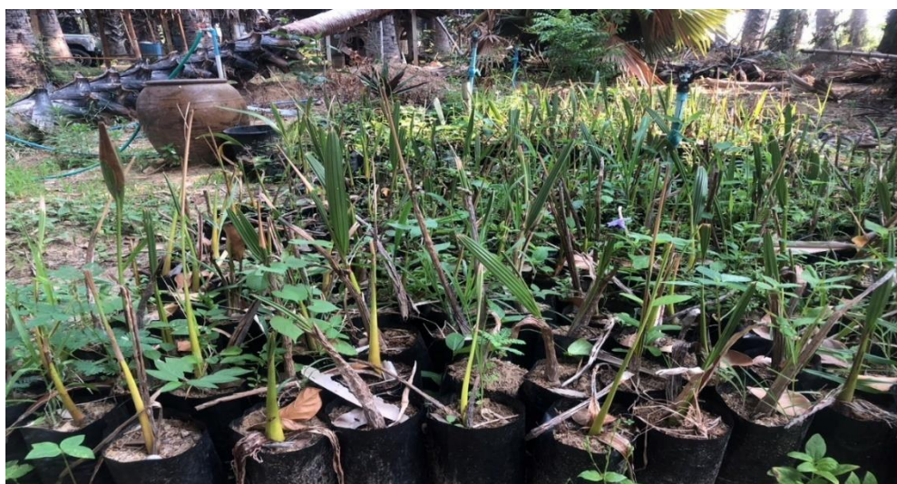
ภาพที่ ๔.๑๐ ต้นกล้าตาล